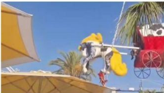
Momento de la caída de la bailarina

Estaba subida en un carruaje con caballos suspendido en el aire cuando parte se rompió y cayó al suelo entre la multitud