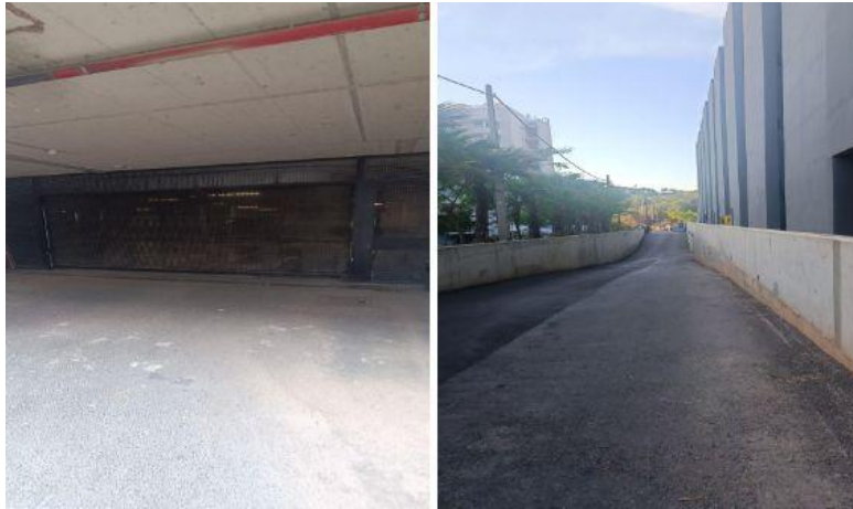
Foto del pàrking en desús que se usó el any passado, la calle donde están los extractores, y la calle (Pere Portugal) que los vecinos piden usar como pàrking suprimiendo la acera. Y calle entre los hoteles que los vecinos exigen se use para evitar las molestias a altas horas de la madrugada.